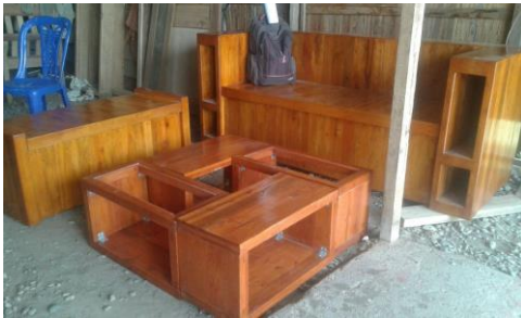
Dokumentasi 10 Furnitur sofa set limbah petik kemas

menggunakan kain kasa, dilakukan berulang hingga tiga kali, 3) langkah berikutnya adalah dengan mengoleskan sat anti rayap pada papan palet sehingga furnitur dapat bertahan lama. 4) tahapan terakhir yaitu dengan mengoleskan vernis sesuai warna kayu agar serat kayu terlihat jelas dengan menggunakan kuas