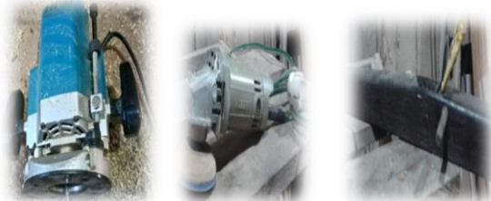
Dokumentasi 6 Alat coak, amplas mesin dan skap