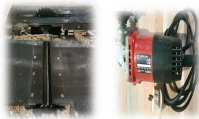
Dokumentasi 7 Mesin pemotong dan skap di pasang di meja