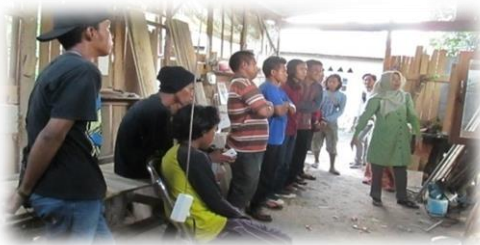
Dokumentasi 2. Presentasi desain

Presentasi/memperkenalkan ke mitra desain/gambar sofa set multifungsi yang akan dipraktekkan oleh mitra yang dihadiri oleh pengrajin meubel kayu yang ada di sekitar mitra dan dihadiri oleh pihak-pihak terkait