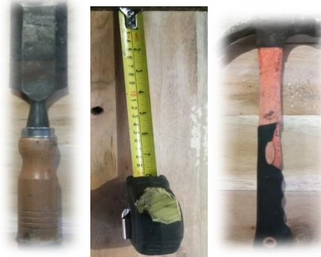
Dokumentasi 4 pengadaan alat pahat, meteran dan palu