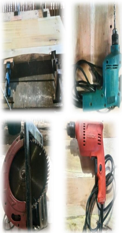
Dokumentasi 8 alat jepit, bor, dan gergaji/alat potong