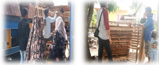
Dokumentasi 3 pengadaan bahan (palet)

Sebelum mengerjakan terlebih dahulu mengadakan bahan baku sofa set yaitu palet dan menyiapkan alat yang akan digunakan dalam pengerjaan sofa set