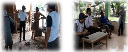
Dokumentasi1 Kegiatan sosialisasi awal ke mitra

desain, bahan yang akan digunakan, komponen-komponen, ukuran dan teknik pengerjaan yang akan diberikan agar mereka mudah memahami dan mengerjakan / praktekkan