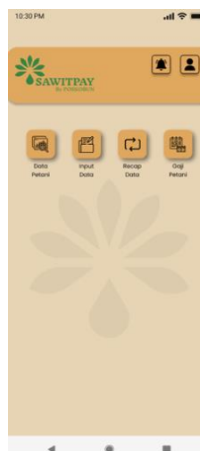
Gambar 2. Halaman Utama Sawit Pay