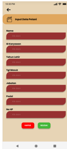
Gambar 3. Halaman Input Data Petani

Halaman input data petani di SawitPay memudahkan pengguna memasukkan informasi dengan kolom isian dan tombol aksi "HAPUS" serta "SELESAI".