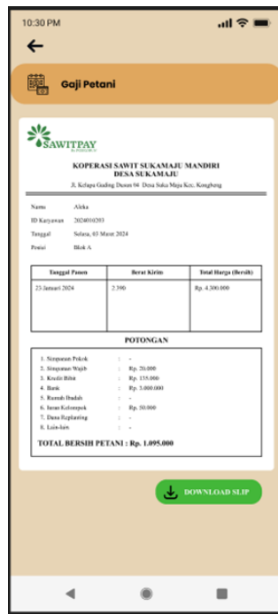
Gambar 5. Halaman Rekap Data Gaji Petani

Halaman "Detail Gaji Petani" di SawitPay menampilkan rincian gaji, potongan, total gaji bersih, dan tombol "DOWNLOAD SLIP" untuk mengunduh slip gaji. Desain rapi dan mudah diakses.