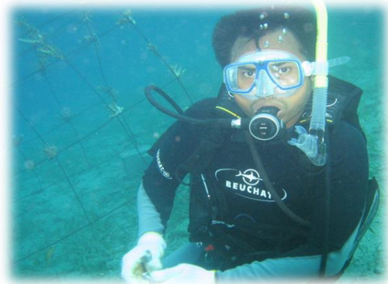
Gambar 2. Foto Kondisi Rumah Ikan di Dasar Laut

tentang kondisi fasilitas yang telah terpasang di dasar laut. Antara lain; rumah ikan ( fish home ), meja transplantasi, serta apartemen ikan telah menunjukkan hasil yang menggembirakan dimana apa yang diharapkan yaitu tumbuhnya terumbu-terumbu karang yang menempel pada sarana fasilitas tersebut telah ada dan tumbuh.