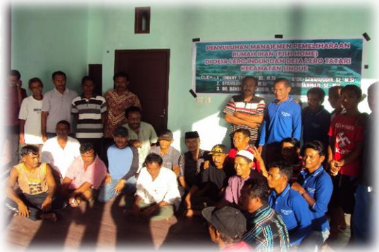
Gambar 1. Foto Bersama Setelah Penyuluhan Selesai

pesisir pantai Desa Lero dapat memahami keadaan ini.