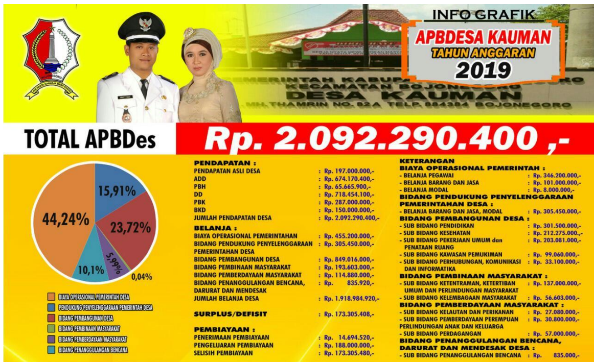
Gambar 1. Contoh Banner OGP yang Terpampang di Desa Kauman, Kabupaten Bojonegoro

Open Government Partnership (OGP) merupakan suatu organisasi kemitraan internasional yang diikuti 78 negara untuk mendorong kolaborasi antara instansi pemerintah dan organisasi masyarakat untuk menghadirkan pemerintah yang akuntabel, responsif, dan inklusif [1]. Konsep “ Open Government ” pada dasarnya mengaktualisasi secara praktis pengertian pemerintahan dari rakyat, oleh rakyat, dan untuk rakyat dimana pemerintah yang terbuka/transparan mengajak seluruh elemen rakyat untuk berkolaborasi memecahkan berbagai masalah demi kesejahteraan rakyat. Di Indonesia, Open Government Partnership merupakan sebuah upaya untuk mendorong kolaborasi antara pemerintah daerah dengan masyarakat sipil dalam mewujudkan pemerintahan yang transparan, partisipatif, dan akuntabel. Kebijakan pemerintah daerah yang kurang mempertimbangkan aspek efisiensi dana belanja modal mengakibatkan kurang optimalnya penggunaan dana suatu daerah.