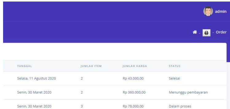
Gambar 4. Fitur Cetak Report/Laporan Pemesanan Barang Pada Halaman Admin

Pada website tersebut, terdapat fitur andalan seperti fitur kupon dan fitur cetak report atau laporan pemesanan barang dan pembayaran barang. Fitur kupon berguna untuk mendapatkan harga barang yang dijual yang lebih murah, mirip seperti model diskon atau potongan harga. Sedangkan fitur cetak report/laporan berguna untuk menampilkan laporan dari pemesanan dan pembayaran barang. Laporan tersebut dapat dijadikan ke format portable document file (PDF).