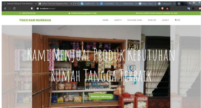
Gambar 2. Tampilan awal halaman website e-Tokel

Dari perancangan website untuk memudahkan transaksi pada toko kelontong secara online, dan penelitian yang telah dilakukan, dapat dihasilkan sebuah sistem informasi berbasis web yaitu website e-Tokel pada Toko Kelontong Sari Nugraha Malang. Dengan adanya sistem ini dapat memudahkan pengelolaan data transaksi pada Toko Kelontong Sari Nugraha Malang oleh fitur-fitur yang ada pada sistem.