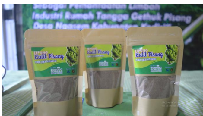
Gambar 1. Produk Teung Kulit Pisang

Limbah dari industri rumah tangga (IRT) SHR yang merupakan penghasil makanan khas oleh-oleh Kediri berupa Gethuk Pisang selama ini hanya dijadikan makanan ternak. Limbah yang berupa kulit pisang ternyata dapat menjadi suatu produk daur ulang yang memiliki nilai lebih yakni berupa tepung kulit pisang. Tepung kulit pisang yang diperkirakan memiliki kandungan karbohidrat yang tinggi.